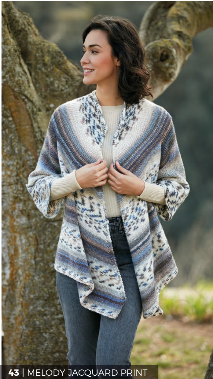
43 | MELODY JACQUARD PRINT