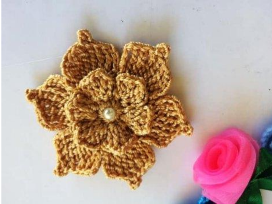
Hoàn thiện sản phẩm