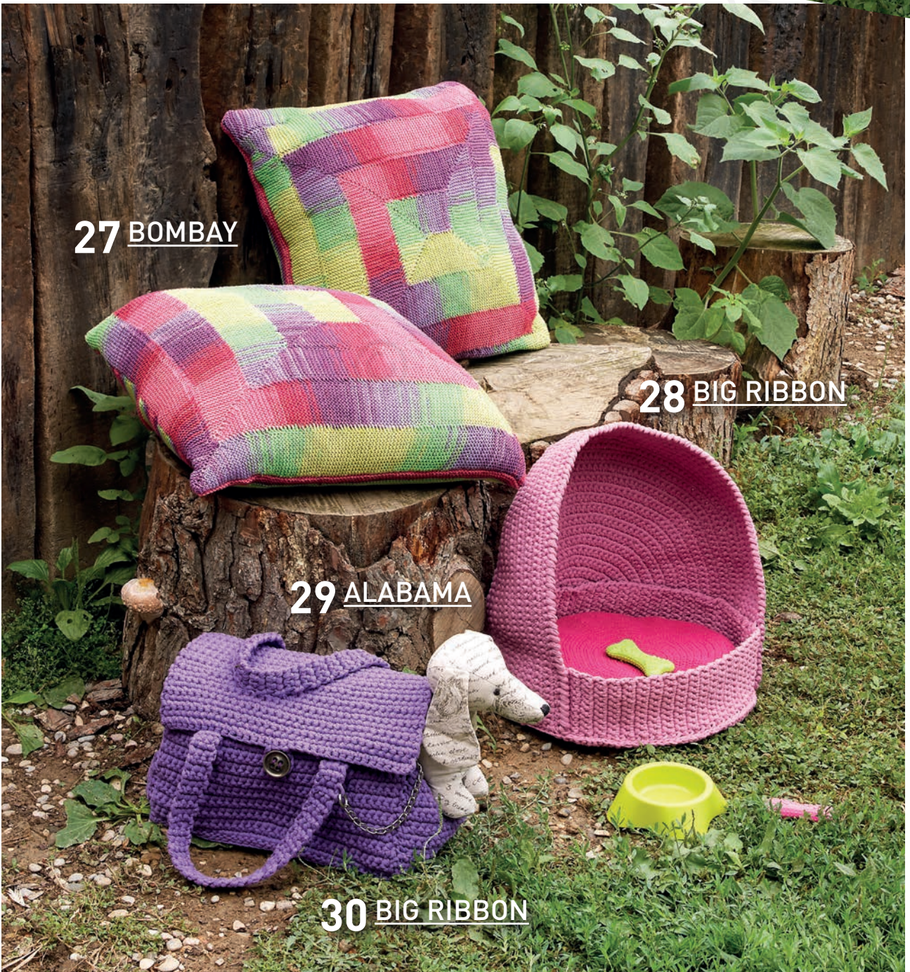
30 BIG RIBBON